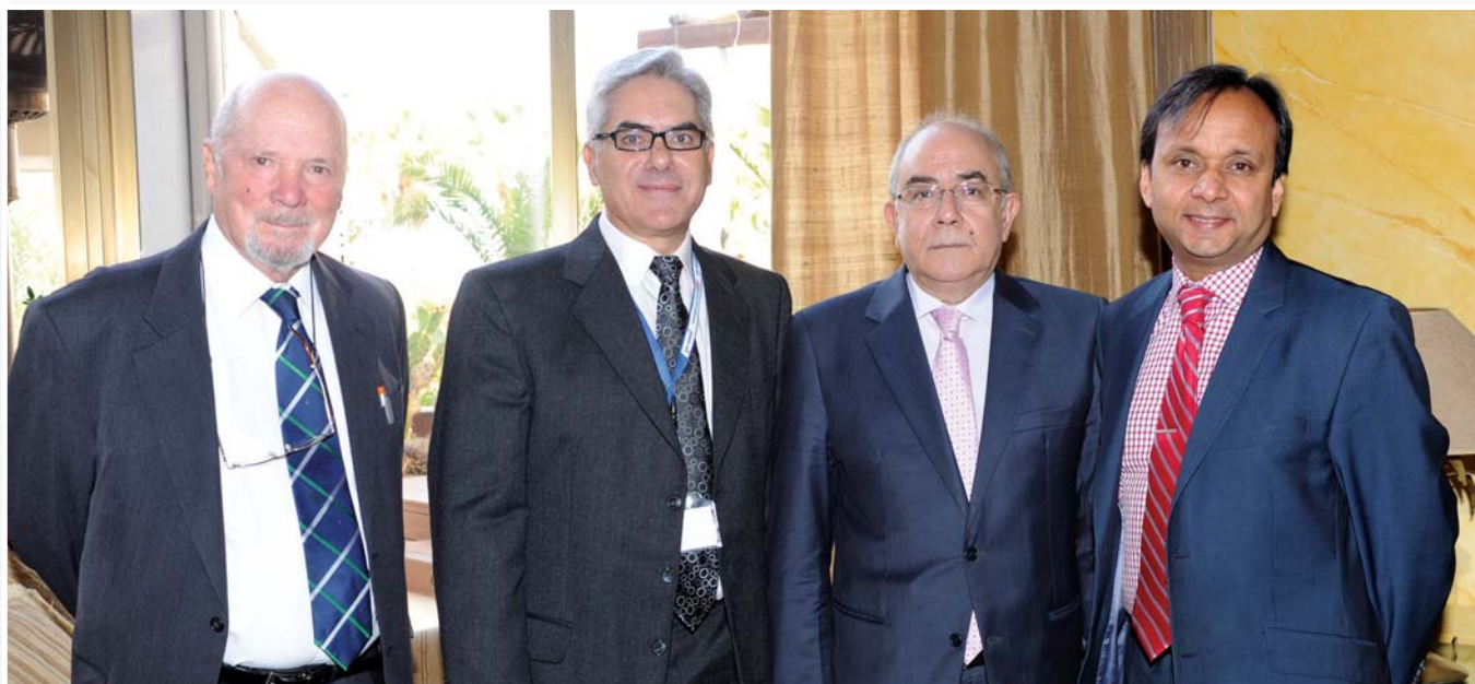
Από Αριστερά ο πρόεδρος του CCEAM Frank Crowther, ο πρόεδρος της Οργανωτικής Επιτροπής του Συνεδρίου Πέτρος Πασιαρδής, ο Πρόεδρος της Βουλής των Αντιπροσώπων Γιαννάκης Ομήρου και ο Vijay Krishnarayan Διευθυντής του Commonwealth Foundation