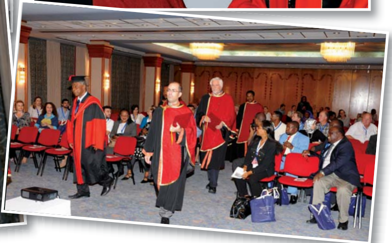
Σκηνές από την τελετή απονομής του τίτλου Επίτιμου Μέλους του CCEAM.