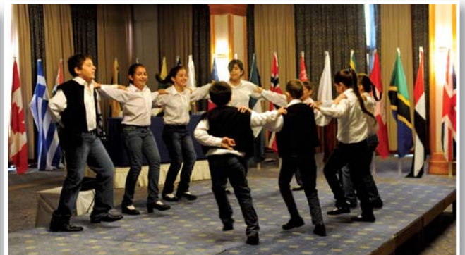
Τελετή έναρξης: χορός από παιδιά του εργαστηρίου παραδοσιακού χορού «Αλεξάνδρα»