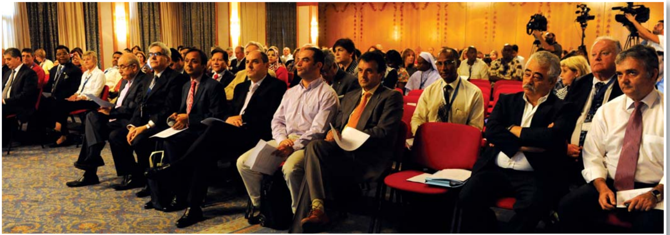
Τελετή έναρξης: Ακροατήριο