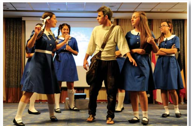
Μαθητές του Λυκείου Πολεμιδιών παρουσιάζουν απόσπασμα από τις «Νεφέλες» του Αριστοφάνη στην τελετή έναρξης