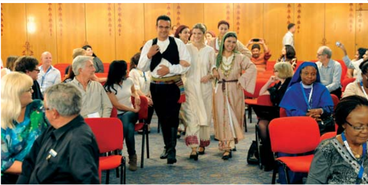
Σκηνή από το καλλιτεχνικό μέρος της τελετής λήξης