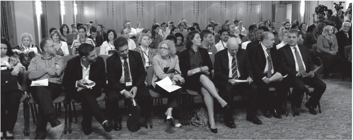
Τελετή έναρξης: Ακροατήριο

Στη δεύτερη ενότητα παρουσιάστηκαν από τον ομιλητή τουλάχιστον δύο νέες προκλήσεις στην εκπαιδευτική ηγεσία, αναζητώντας επίμονα την «Ουτοπία». Έτσι αρχικά υποστήριξε ότι υπάρχει ανάγκη διεύρυνσης της αντίληψης που επικρατεί για το τι είναι καλό σχολείο και πώς αυτό αξιολογείται. Ταυτόχρονα, φαίνεται να υπάρχει ανάγκη μετακίνησης από την τάση one-size-fits-all που ταιριάζει σε όλα τα θέματα εκπαίδευσης στην προσέγγιση της εκπαιδευτικής ηγεσίας, γιατί αδιαμφισβήτητα η επιτυχία σε κάθε σχολικό οργανισμό εξαρτάται από τις ξεχωριστές εμφάσεις/προτεραιότητες που η κάθε μια μαθησιακή κοινότητα ιεραρχεί συλλογικά.