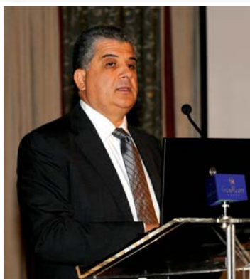
Ο Υπουργός Παιδείας και Πολιτισμού Δρ. Γιώργος Δημοσθένους απευθύνει χαιρετισμό